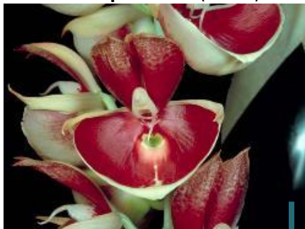
Catasetum pileatum (Ovule)