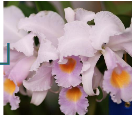
Cattleya schroederiae (pollen) 50%

Famille : Orchidaceae, Sous-famille : Epidendroideae, Tribu : Epidendreae, Sous-tribu : Laeliinae